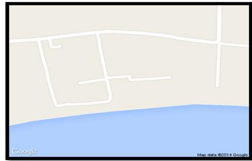
Gambar 3.1. Pantai Libuo

Kabupaten Puhuwato merupakan salah satu daerah Tujuan Wisata yang ada di Provinsi Gorontalo terletak di jalur pantai selatan Provinsi Gorontalo. Posisi ini merupakan salah satu kabupaten strategis di sepanjang jalur pantai selatan karena intensitas lalu lintas dan pembangunan jalan sekaligus mendorong perkembangan Kabupaten Puhuwato. Arus pergerakan transportasi dari arah barat maupun timur ini yang cukup besar dan padat sangat