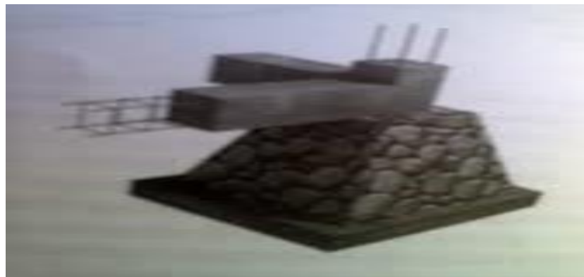
Gambar 4.14. Pondasi Umpak

sedehana yang kondisi tanahnya cukup baik.