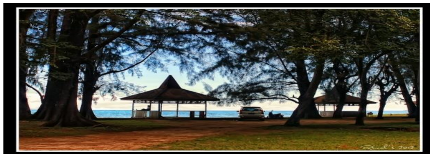
Gambar 3.2. Pantai Libuo

Wisata Pantai ini terletak di Kelurahan Libuo yang terkenal dengan Desa Puspa atau Desa Bunga, Kecamatan Paguat Kabupaten Puhuwato Provinsi Gorontalo. Garis pantai ini membentang lurus dengan pasir putih yang tertata sangat indah. Seluas mata memandang jarak palung lautnya sekitar 100 m dari tepian pantai.