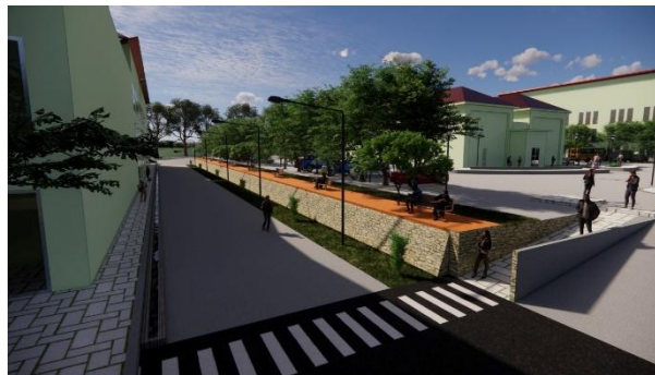
Gambar 5. Pembuatan talud pembatas kontur dengan pengolahan aliran air hujan