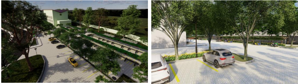
Gambar 4. Pemanfaatan Pulau Pohon Pada Lahan Parkir Sebagai Area Bio-retention swale Fakultas Teknik dan Fakultas MIPA

menghasilkan kanopi yang cukup (Saphiro et.al , 2015 ) sebagaimana terlihat pada gambar 2.7, untuk menaungi kendaraan dan pengendalian air air hujan area parkir sebagai mana hasil penelitan Sari et.al , (2018) bahwa pada area perkerasan untuk parkir juga harus memiliki pulau pulau serta vegetasi yang memiliki kemampuan menyerap air. sehingga tidak sampai terjadi genangan pada area parkir.