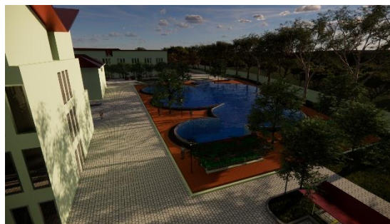
Gambar 6. Kolam untuk konservasi pada bagian belakang Fakultas MIPA dan Fakultas Teknik (area terendah tapak)