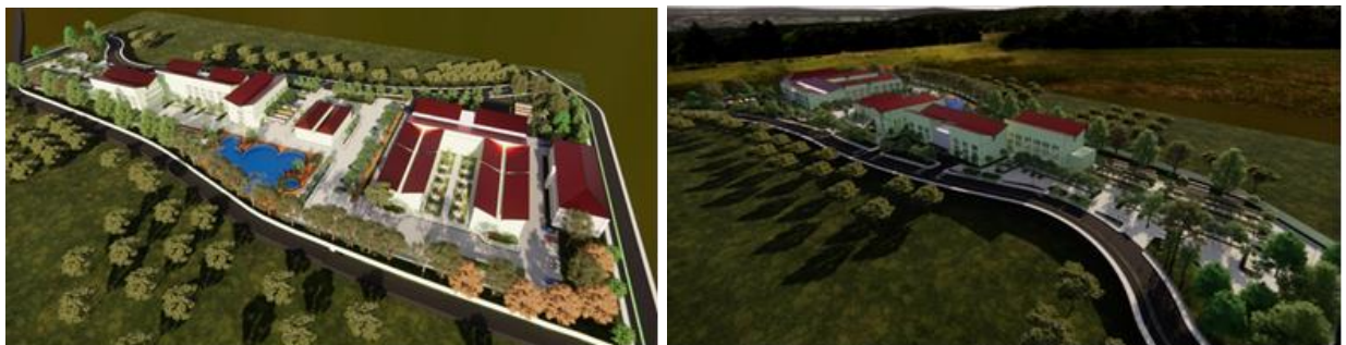
Gambar 7 Tampak Atas Pemodelan Green Parking Yang Berkelanjutan Pada Fakultas MIPA dan Fakultas Teknik

Tampak atas tampilan pemodelan Green Parking Yang Berkelanjutan dengan titik sampel lokasi pada Fakultas MIPA dan Fakultas Teknik Universitas Negeri Gorontalo bisa dilihat pada gambar di bawah ini :