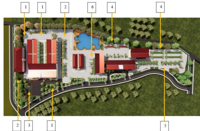
Gambar 2. Penataan area parkir pada Fakultas MIPA dan Fakultas Teknik

Selain penataan area untuk parkir, disediakan juga tempat untuk pejalan kaki ( pedestrian ) yang aman untuk menghubungkan dengan keanekaragaman penataan vegetasi di seluruh tempat parkir untuk meningkatkan habitat dan memberikan daya tarik visual dan warna (Saphiro et.al , 2015 ), untuk mencapai kenyamanan thermal (Sangaji, et al , 2013) dan untuk memenuhi minimal persyaratan area ruang terbuka hijau atau KDH (Koefisien Dasar Hijau) di kabupaten Bone Bolango) sesuai Peraturan Daerah Kabupaten Bone Bolango Nomor 5 Tahun 2021 tentang Rencana Tata Ruang Wilayah Kabupaten Bone Bolango Tahun 2021 – 2041, bahwa Koefisien Daerah Hijau (KDH) adalah 20 (duapuluh) persen.