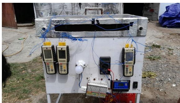
Sumber: Foto setup pengujian Gambar 1. Setup pengujian

Tempat dan waktu penelitian di halaman laboratorium terpadu kampus Universitas Gorontalo. Selain itu workshop Teknik Mesin digunakan untuk menganalisis hasil data. Sedangkan alat dan bahan yang digunakan dalam penelitian adalah Multimeter, solar power meter, thermocouple, panel surya tipe monocrystalline dan bahan penelitian menggunakan besi hollow sebagai rangka pendukung untuk dudukan dari panel surya sebagai objek penelitian seperti yang ditunjukkan pada gambar 1.