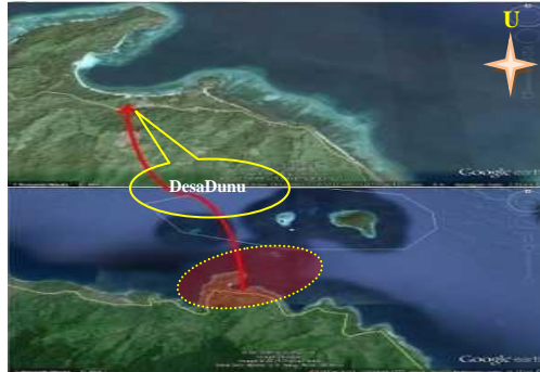
Gambar 2. Peta Udara Lokasi Pantai Dunu Kec. Monano Kab. Gorontalo Utara

Desa Dunu terbagi atas 3 dusun yaitu Dusun Dinuke, Dusun Mutiara dan Dusun Molosifat. Desa Dunu sampai tahun 2014 dihuni oleh 645 jiwa yang terbagi pada 168 Kepala keluarga.