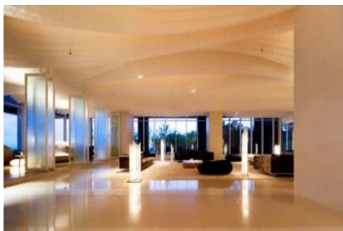
Gambar 8. Suasana hotel siang hari

Berbagai fasilitas yang di suguhkan untuk melengkapi kawasan wisata ini diantaranya hotel dengan berbagai tipe dan ukuran kamar didesain dengan konsep teknologi tinggi dengan tetap mempertahankan view yang menyatu dengan pantai.