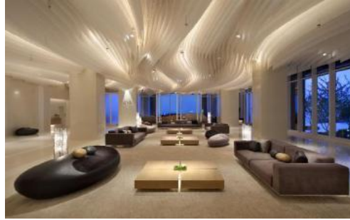
Gambar 9. Desain Interior hotel dengan konsep teknologi

Pada malam hari, meninggalkan aksentasi pencahayaan dari atas pola kain linear. Seluruh volume langit-