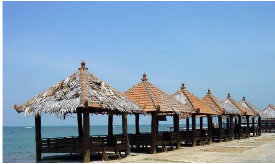
Gambar 4. Gazebo di sepanjang pesisir pantai

laut, seperti cumi-cumi, cakalang, layur, dan lainnya, kerang laut, dan berbagai jenis terumbu karang.