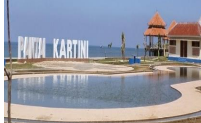
Gambar 3. Kawasan Wisata Pantai Kartini

Objek Wisata Pantai Kartini Rembang adalah pantai yang bersih, kualitas air yang jernih, ombak yang relatif kecil,