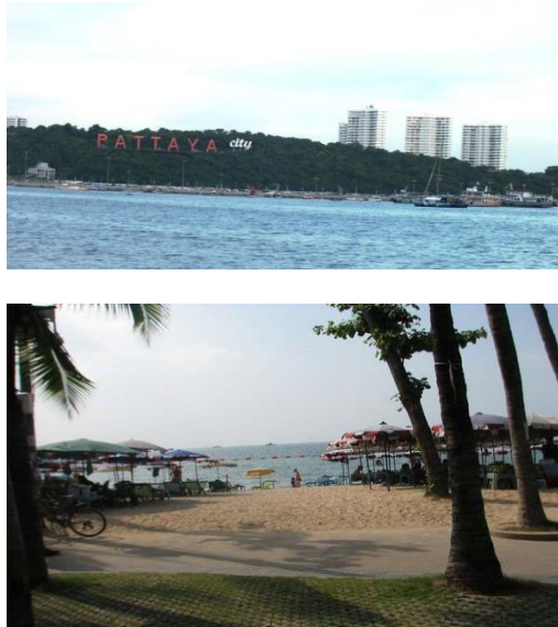
Gambar 7. Suasana Pantai Pattaya Menjelang Malam

tetapi suasana meriah namun tenang. Trotoarnya bersih dengan taman sederhana, namun penuh dengan bunga warna-warni.