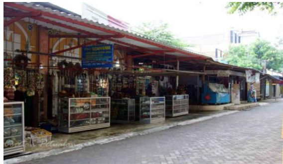
Gambar 5. Pusat Penjualan Soufenir

dijangkau. Tepatnya terletak di Desa Bulu, Kecamatan Jepara, Kabupaten Jepara, Provinsi Jawa Tengah.