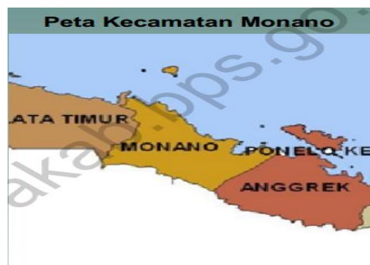
Gambar 1. Peta Kecamatan Monano