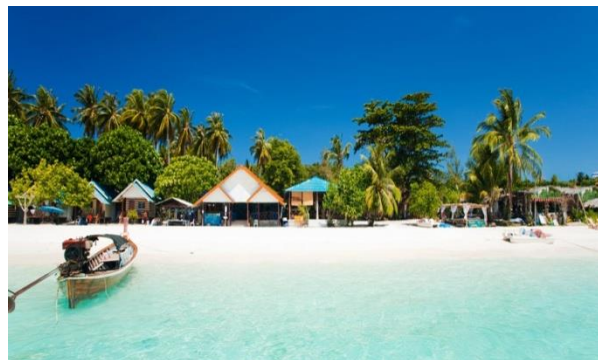
Gambar 6. Lokasi Pantai Pattaya

Pattaya adalah salah satu tujuan wisata utama ketika berkunjung ke Bangkok. Kota Pattaya dapat ditempuh hanya dalam waktu 1 jam 30 menit