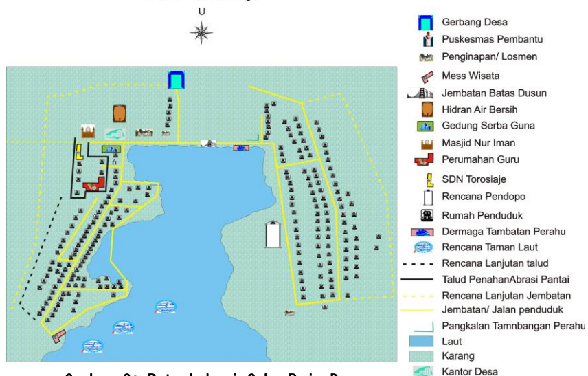
Gambar 2: Peta Lokasi Suku Bajo Desa