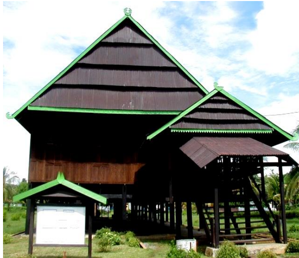
(Gambar 4) Rumah tradisional etnis Bugis Bone (klasik – bolasoba/saoraja) rumah bangsawan/keturunan raja) Bugis Bone