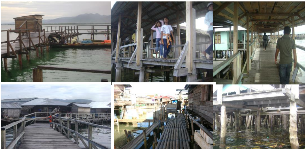
(Gambar 6) tetean atau jembatan penghubung