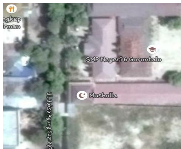
Gambar 1 Lokasi Penelitian

Hari/Tanggal : Sabtu, 15 Desember 2015 – Minggu, 16 Desember 2015 Pukul : 09.30 – 06.00 Wita Lokasi : Jalan Jaksa Agung Soeprapto depan SMP 6 Gorontalo